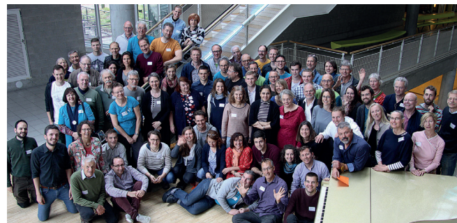
Rencontre internationale des délégués nationaux en 2019 à Stuttgart